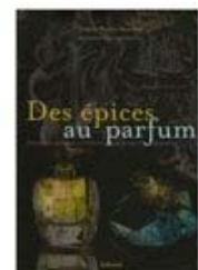
Des épices au parfum

d'Annick Goutal, Sublime de Jean Patou, Chanel n°5, Coco Mademoiselle, Poison de Christian Dior et beaucoup d'autres. Extrait de Des épices au parfum